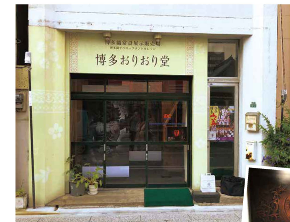
△大通りから一步入った昔ながらの博多の街並みになじむ「おりおり堂」。観光や街歩きついでに気軽に立ち寄れるスポット。