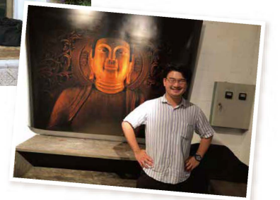
▽「巡航一御仏と、博多織が紡ぐ御供所町」の写真家・廣瀬孔明氏