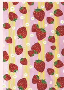
第22回の優秀賞を受賞した「あまおうの幸せ」

福岡県内の高校生を対象に、博多織に新しい新風を巻き込む図案を募集する博多つくりベデザインコンクール。2021年度は、県内10校から606点の応募があり大変賑わいました。今年も高校生を対象に募集中! 審査の様様や、入選作品は随時ホームページ、SNS等でご紹介していきます。